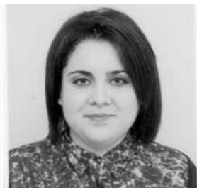
A ma fille