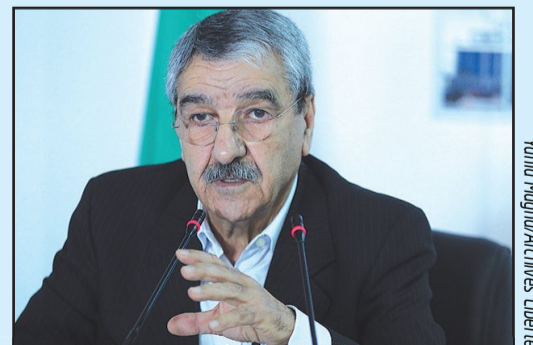
Yahia Magharchives/Archives Liberté