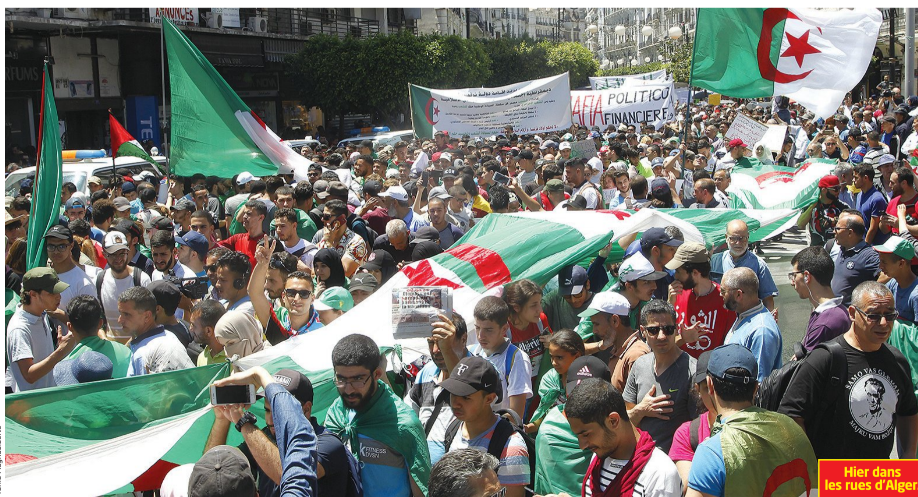
Hier dans les rues d'Alger.

FIN DE LA PREMIÈRE INSTRUCTION DANS L'AFFAIRE TAHKOUT